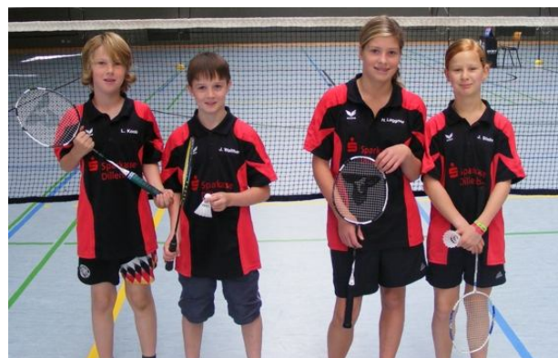
Saison 2011/2012 der Mini U13 Mannschaft